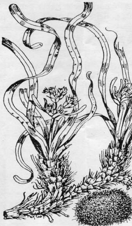
Alga dels vidriers

fresc. Gairebé tots els animals s'alimenten dels epífits (organismes que viuen a sobre de la planta sense alimentar-se d'ella), de les restes de planta descomposats per l'acció bacteriana, o bé són filtradors.