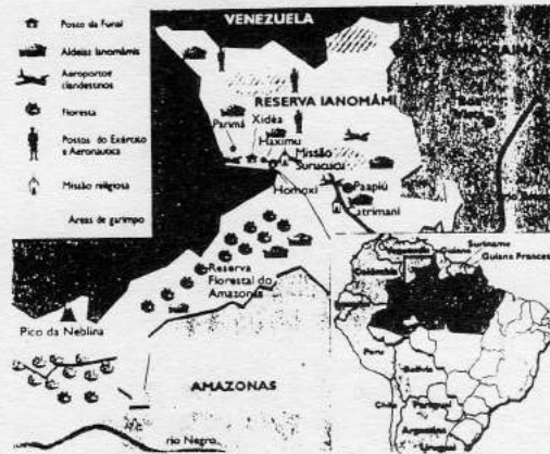
Gràfic 2. Reserva dels Ianomamis

Tot i davant la indefensió dels Ianomamis hi ha sectors del Brasil com la OAB (Ordre dels Advocats do Brasil) que demanarà un procés d'intervenció federal a Roraima. Segons ells les accions contra els Ianomamis són recolzades pel govern local.