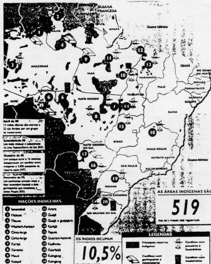
Gràfic 1. Distribució de les 20 tribus