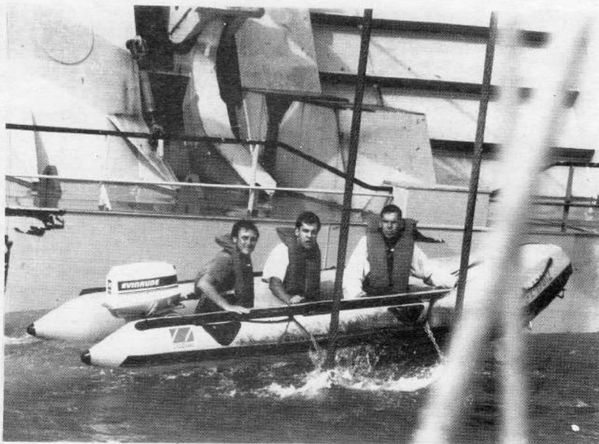
Membres l'APMA i de GREENPEACE durant l'acció

herbeis de Possidonia , també seran colgats a la zona on es diposita la sorra, ja que les platges regenerades perdran la seva sorra d'aquí 5 anys. El perill d'aquest projecte es que s'engloba dins d'un irracional pla del MOPMAT que preveu la regeneració del