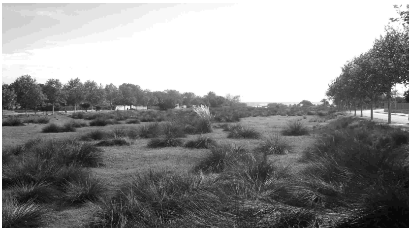
Desembocadura del riu Foix

L'alternativa presentada per l'Associació Fauna de Cubelles, que planteja com a mal menor construir el pont en el lloc on actualment ja existeix un pas encimentat dins de la llera del riu, cosa que, no perjudicaria més aquest espai, està avalada per un enginyer de camins, en un informe sobre les possibilitats tècniques d'execució, però l'ajuntament de Cubelles no ha volgut fer-ne cap cas tot i que entenem que, en exercici de la seva responsabilitat municipal, hauria d'aportar un estudi de viabilitat tècnica. Una vegada més està en joc la salvaguarda d'un tros del patrimoni natural del litoral català amenaçat per interessos particularistes.