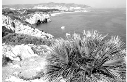
Vista panoràmica de l'espai natural dels Colls i Miralpeix. Un espai encara per protegir definitivament.

A Sitges, de forma inesperada, el novembre de 1997 una sentència del Tribunal Suprem anul·là la Pla General d'Ordenació de 1989, per una causa que res tenia a veure amb ECM. Gràcies a la pressió de la plataforma i de la Generalitat es va poder aprofitar la sentència per abandonar les pretensions d'urbanitzar les Coves i Comarroja, els dos sectors més extensos d'ECM sitgetans. Actualment tenen la qualificació de no urbanitzables. Ni l'Ajuntament ni la Generalitat s'atreveren a aturar les obres a Can Girona –el sector que circumda el camp de golf– amb el consegüent desastre ecològic i estètic que avui és ben palès. L'excusa: les obres d'urbanització estaven molt avançades. La lluita per la preservació de Can Girona va continuar, però fou infructuosa.