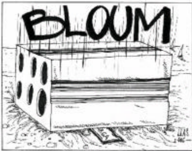
Autor: Lluís Amaré. Publicat al Diari de Vilanova, 17-2-06

Platja Llarga: a 7 de juny ja hi ha vigilància a la platja, han posat cartells, han netejat i han demanat a l'empresa que reforci la tanca, però la vigilància té problemes perquè els vigilants forestals municipals no tenen capacitat per sancionar ni mitjans per fer complir la llei. Van dir que han demanat ajut al SEPRONA. Resultat: A 30 de juny els vehicles, igual que l'estiu passat, segueixen trepitjant la zona de protecció, la gent hi porta els gossos i la brutícia s'acumula a dojo, això sí els cartells hi són.