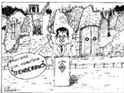
Autor: Lluís Amaré. Publicat al Diari de Vilanova, 28-4-06

Des de l'Associació de Veïns Centre Vila la primavera del 2005 vàrem començar una intensa campanya per tal de conscienciar sobre la problemàtica urbanística del Casc Antic de la ciutat. El mes de Setembre un petit estudi ens feia adonar que s'havien enderrocat, en els barris de la Geltrú i Vilanova Vella, més de 110 portes de carrer. En el mateix estudi vàrem poder observar que les noves edificacions que s'aixecaven, tot i formar part de conjunts històrics, inexplicablement no conservaven els trets característics de les cases de l'entorn, produint-se una clara intrusió constructiva.