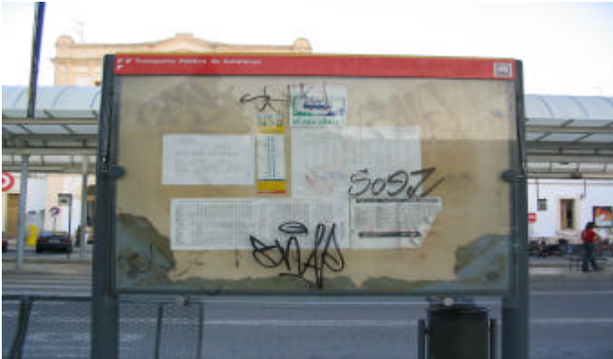
Cara i creu de l'únic plafó informatiu d'autobusos interurbanas al Garraf

Costa d'entendre com, en una època on la publicitat del producte és vital per a la subsistència de qualsevol empresa, les companyies concessionàries de línies interurbanas d'autobusos de la comarca tenen nul interès en donar a conèixer els seus recorreguts i els seus horaris. Sembla com si l'esforç que fa l'empresa s'acabés quan li és atorgada la concessió de la línia per un grapat d'anys i només obeïssin sense iniciativa