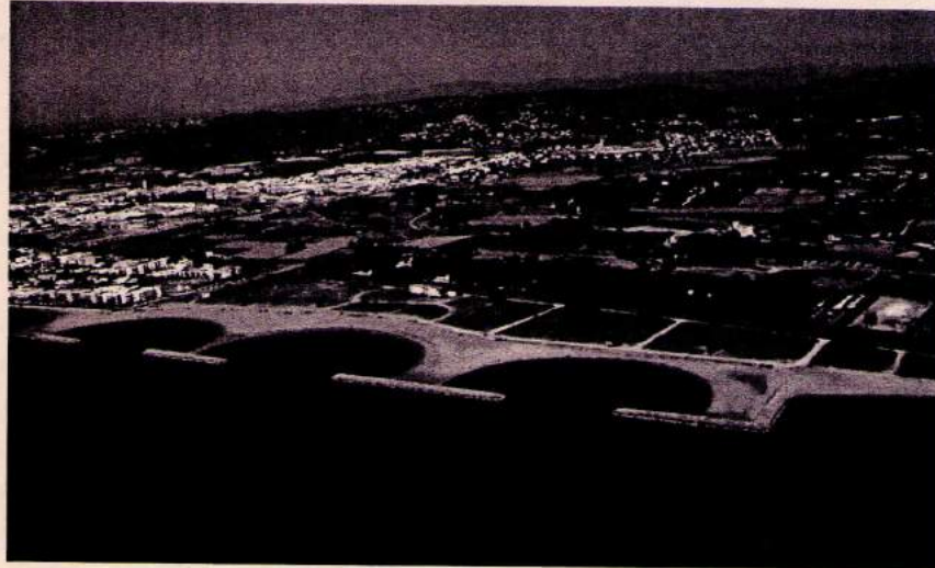
Platja Llarga. Setembre de 2003.

residencial brutal, l'Ajuntament no ha optat per recuperar el sòl i fer un pla de protecció integral de la zona (no hi ha cap estudi en aquest sentit), ans al contrari, ha acceptat majors alçades i major concentració d'habitatges i de places hoteleres. Ja veurem també com es desenvoluparà urbanísticament la zona interior contigua, si es